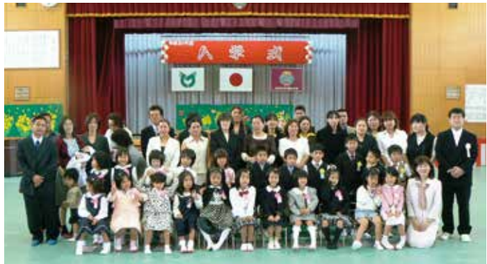
小学校入学 広報いへや平成 20 年 5 月号