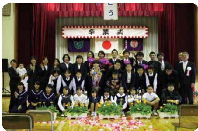
中学校卒業 広報いへや平成 29 年 4 月号