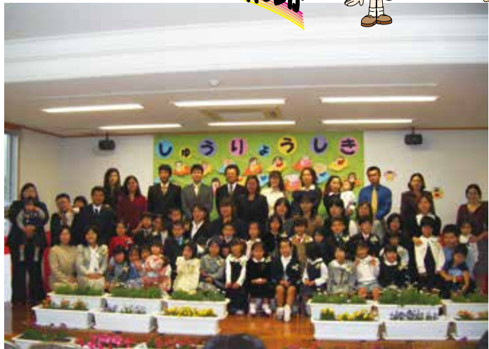
幼稚園卒園 広報いへや平成 20 年 4 月号