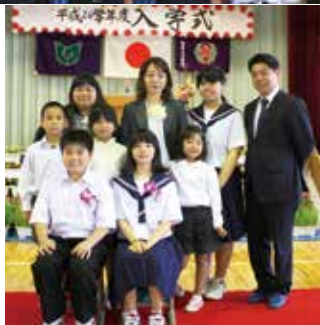
広報いへや 平成 26 年 5 月号