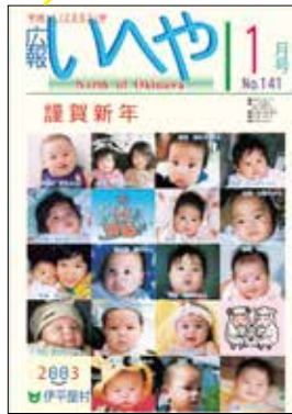
広報いへや 平成 15 年 1 月号