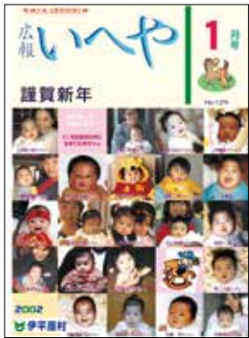
広報いへや 平成 14 年 1 月号