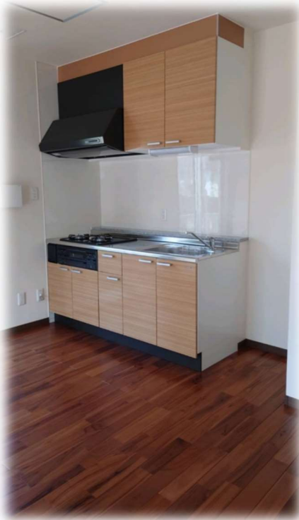
① ダイニングキッチン