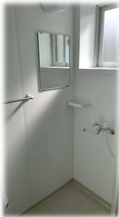
② シャワーユニット