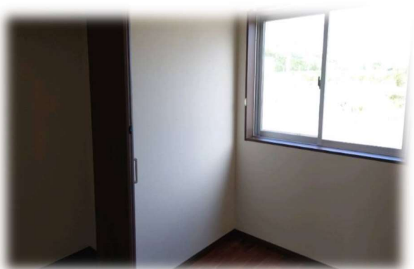
⑦ 洋室 2 箇所