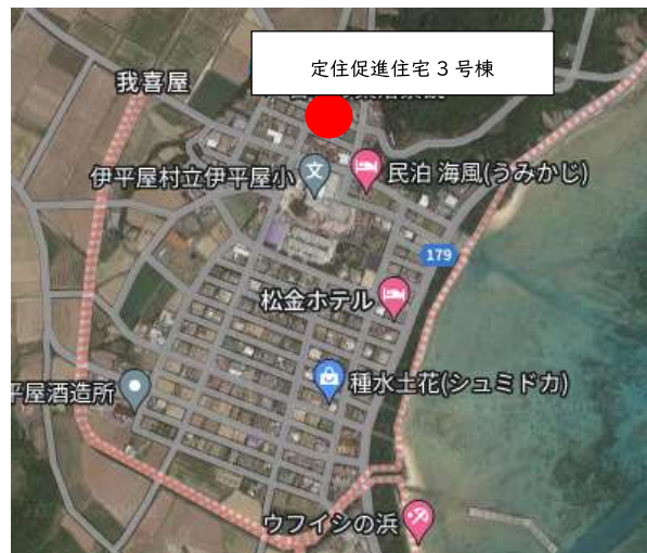
【 我喜屋区 】