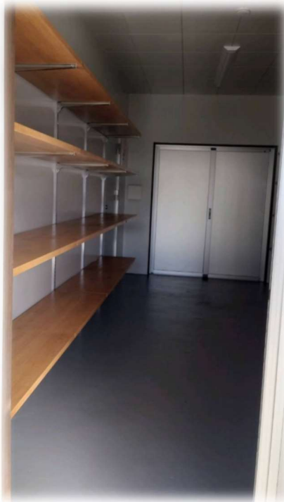
④ 倉庫 (棚両サイド付き)